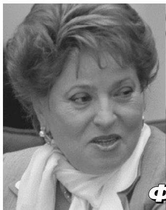
Фракция КПрФ - губернатору: