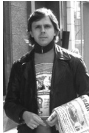
Андрей Клычков, руководитель фракции КПРФ в Мосгордуме

Помощь товарищам из других регионов давно стала доброй традицией ленинградских коммунистов. Не стали исключением и недавние выборы в Московскую городскую Думу. Несколько десятков членов КПРФ и СКМ из города-героя Ленинграда, приехав в Москву, работали на избирательных участках, помогая коммунистам столицы при проведении голосования и при подведении его результатов.