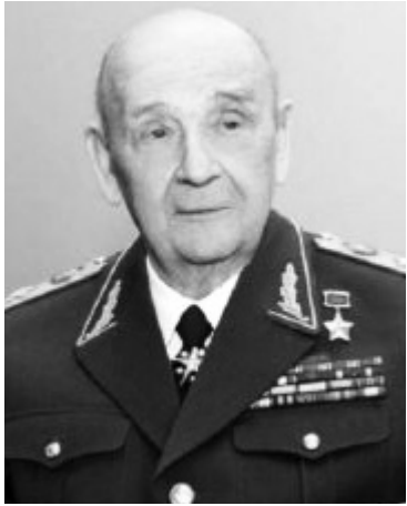
Маршал Советского Союза Герой Советского Союза Сергей Леонидович СОКОЛОВ:

Дорогие ленинградцы, друзья, однополчане!