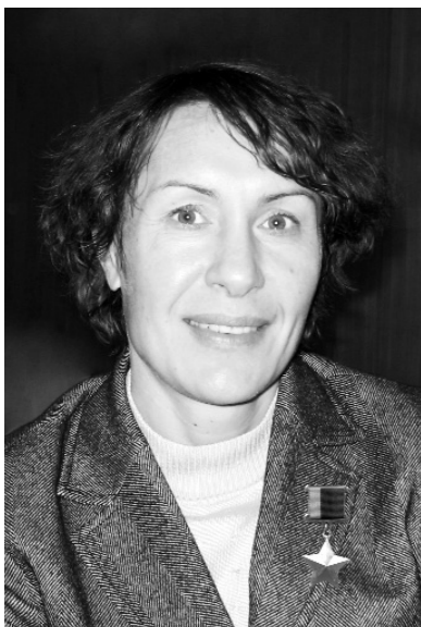
Герой России, почётный гражданин Санкт-Петербурга

Шлю горячий привет своим однополчанам по Карельскому фронту, Заполярью, коллегам по службе в Ленинградском военном округе. Здоровья вам, друзья, сил и оптимизма! С Днём Победы!