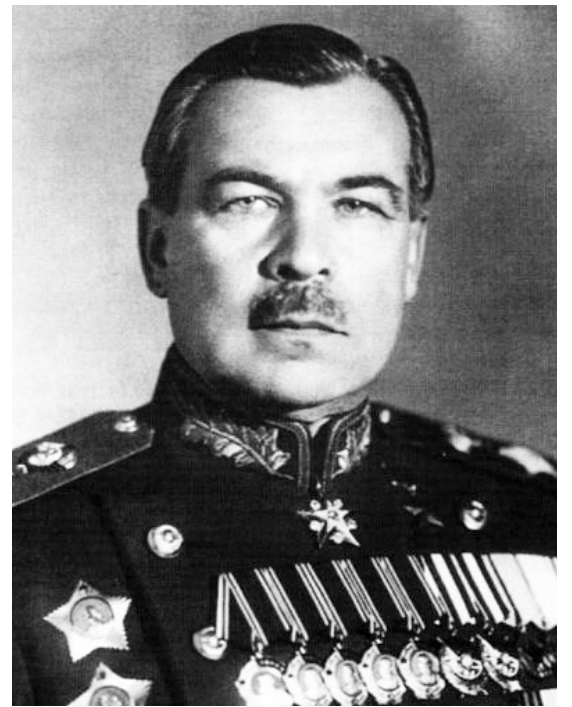
Маршал Советского Союза Леонид Александрович ГОВОРОВ