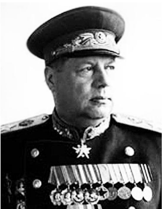
Маршал Советского Союза Фёдор Иванович ТОЛБУХИН