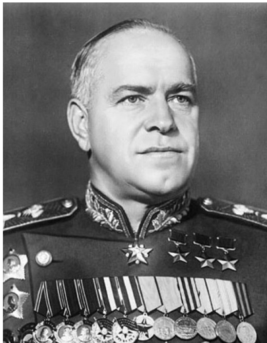
Маршал Советского Союза Георгий Константинович ЖУКОВ