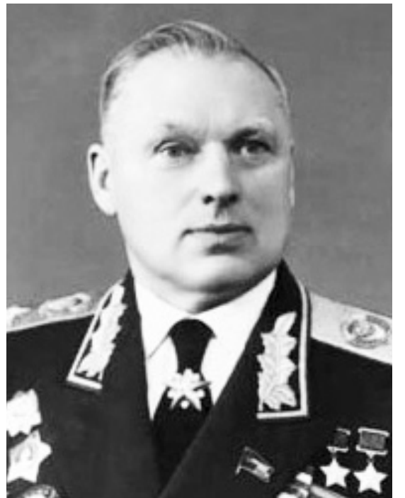
Маршал Советского Союза Константин Константинович РОКОССОВСКИЙ