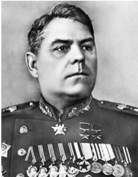
Маршал Советского Союза Александр Михайлович ВАСИЛЕВСКИЙ