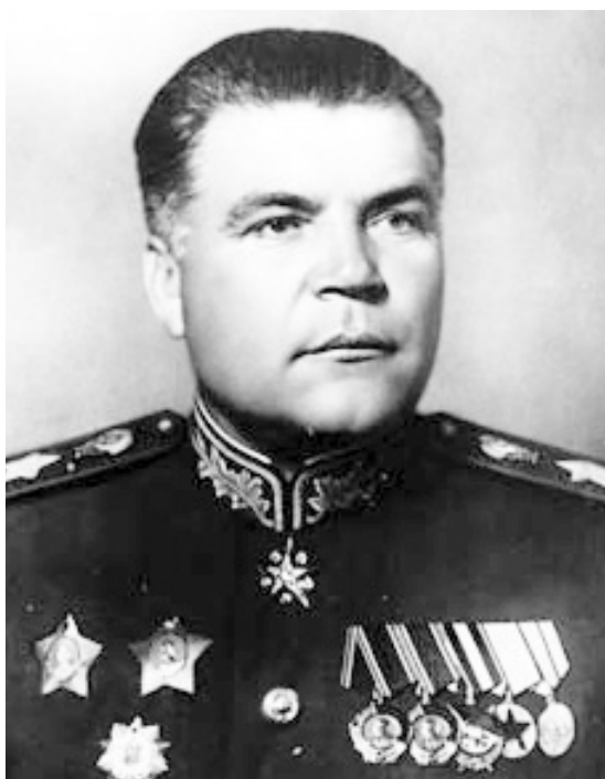
Маршал Советского Союза Родион Яковлевич МАЛИНОВСКИЙ