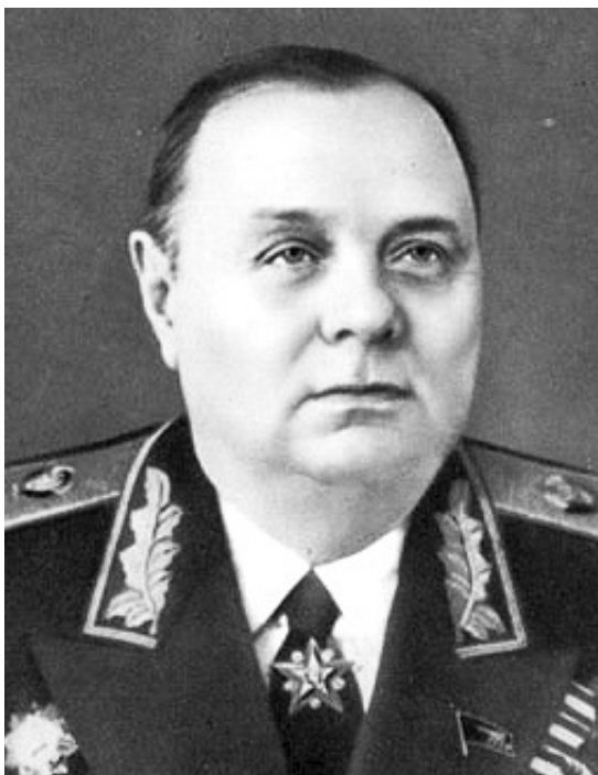
Маршал Советского Союза Кирилл Афанасьевич МЕРЕЦКОВ