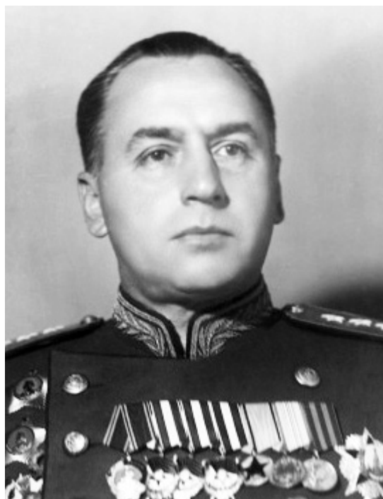
генерал армии Алексей Иннокентьевич АНТОНОВ