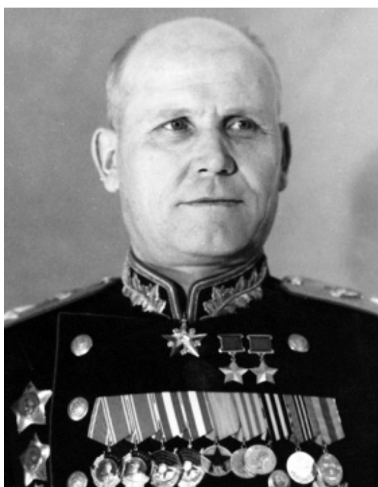
Маршал Советского Союза Иван Степанович КОНЕВ