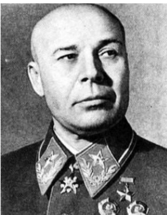
Маршал Советского Союза Семён Константинович ТИМОШЕНКО