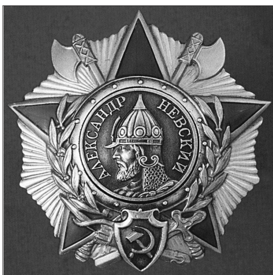
А вот какова судьба ордена Александра Невского. Выше - фронтовая реликвия времён Великой Отечественной, а справа - то, что будут жаловать чиновникам за верную службу «национальным лидерам».

рили. Помимо этого, зачем-то упразднили медаль «За отличие в перепи- си населения» - и вдвойне нелогично это выглядело как раз накануне очередного всероссийского статистического исследования; взяли и обидели ни за что честных тружеников, как