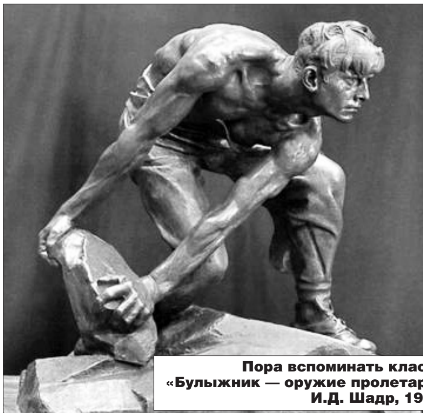
Пора вспоминать классиков! «Булыжник — оружие пролетариата». И.Д. Шадр, 1927 год.

Если организм заболел — его нужно лечить. Эта логика понятна любому человеку, если только он не сумасшедший. Если больно общество — его тоже надо лечить. Эта мысль, столь же логичная, почему-то редко приходит в умы тех, на чьих плечах лежит ответственность за здоровье этого самого общества.