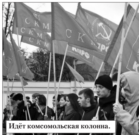
Идёт комсомольская колонна.

Выступает народный артист России коммунист Владимир Бортко.