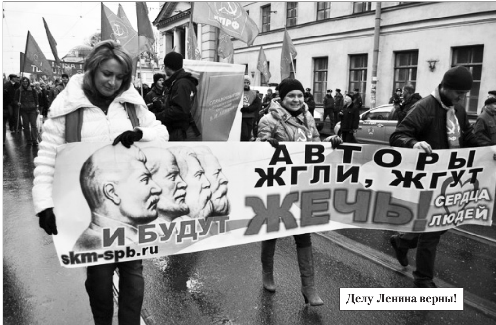
Делу Ленина верны!