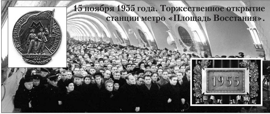
15 ноября 1955 года. Торжественное открытие станции метро «Площадь Восстания».