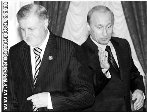
За «справедливого» Путина