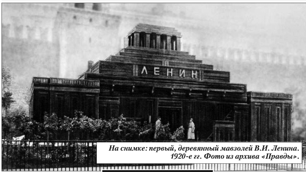
На снимке: первый, деревянный мавзолей В.И. Ленина. 1920-е гг.

В связи с развязанной «Единой Россией» кампанией по обоснованию необходимости якобы захоронения В.И.Ленина любому трезвомыслящему человеку бросаются в глаза откровенная ложь, подленькие подмены понятий и нелепицы