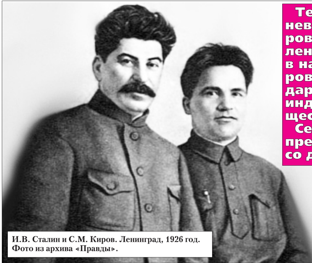
И.В. Сталин и С.М. Киров. Ленинград, 1926 год.

Тем, кому сегодня меньше тридцати, часто невдомёк, в честь кого названы города Киров, Кировск и десятки других, кому поставлено столько памятников, сохраняющихся и в наше время. А ведь Сергей Миронович Киров был одним из тех крупнейших государственных деятелей, кто заложил основу индустриальной мощи, политического могущества и величия Страны Советов.