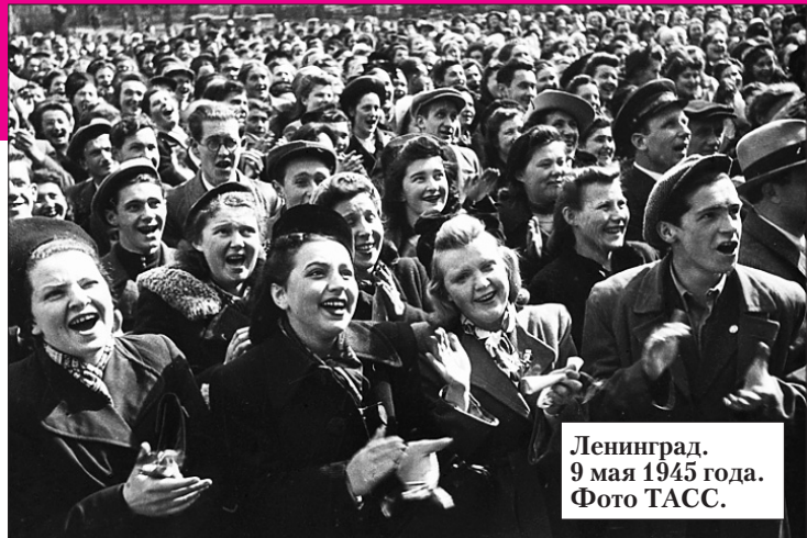
Ленинград. 9 мая 1945 года.