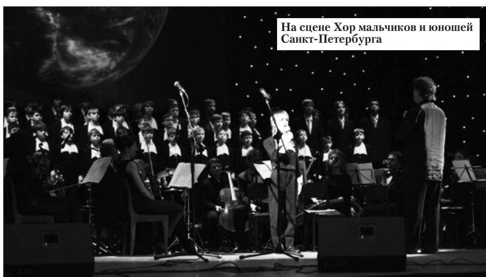
На сцене Хор мальчиков и юношей Санкт-Петербурга