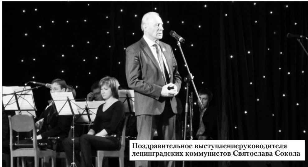
Поздравительное выступление руководителя ленинградских коммунистов Святослава Сокола