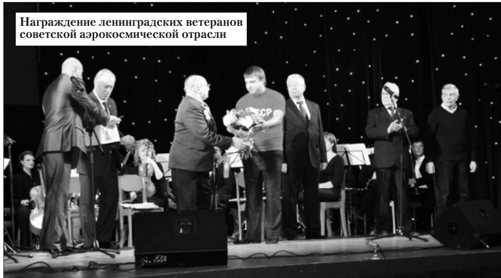
Награждение ленинградских ветеранов советской аэрокосмической отрасли