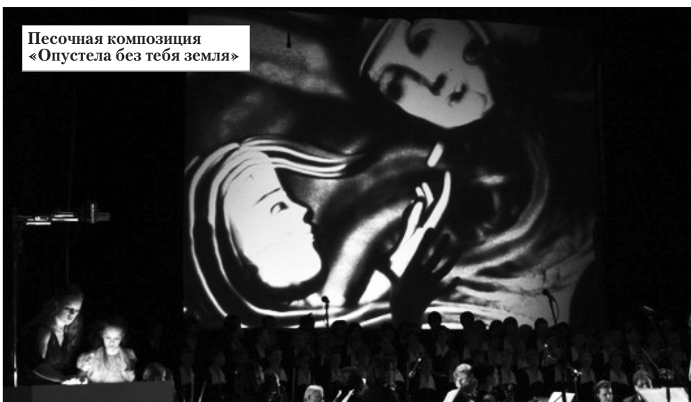
Песочная композиция «Опустела без тебя земля»