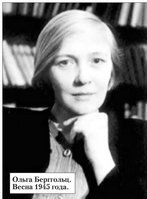
Ольга Берггольц. Весна 1945 года.

Никто не скажет о войне правдивее, яснее и пронзительнее, чем человек, переживший войну. Ольга Берггольц не просто пережила её — она навеки стала символом борьбы Человека за жизнь Ленинграда, за жизнь на Земле. Сегодня мы публикуем отрывок из книги О.Ф. Берггольц «Говорит Ленинград». Этот очерк и стихотворение были написаны 3 мая 1945 года.