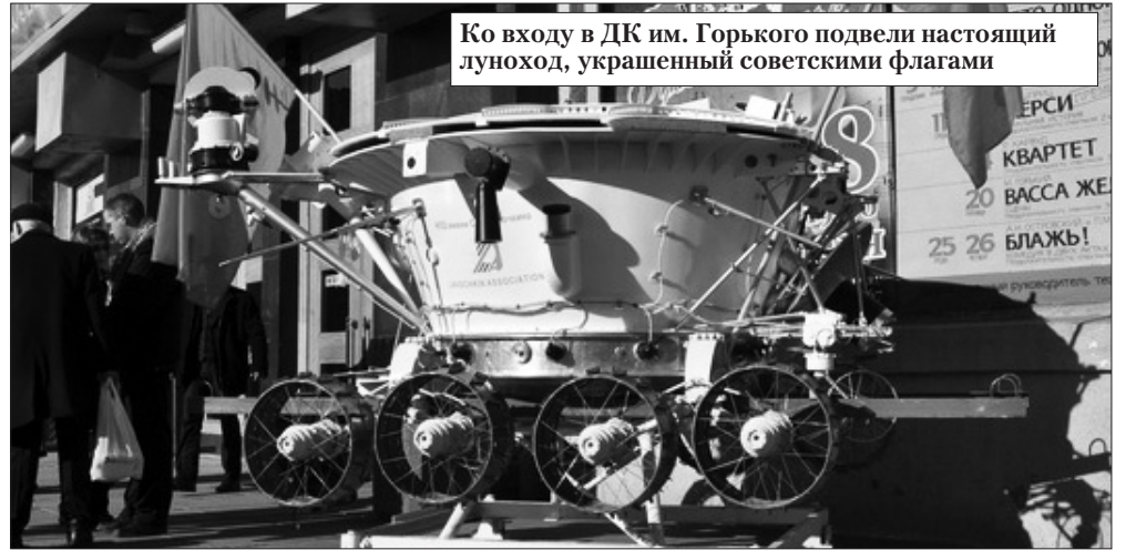
Ко входу в ДК им. Горького подвели настоящий луноход, украшенный советскими флагами