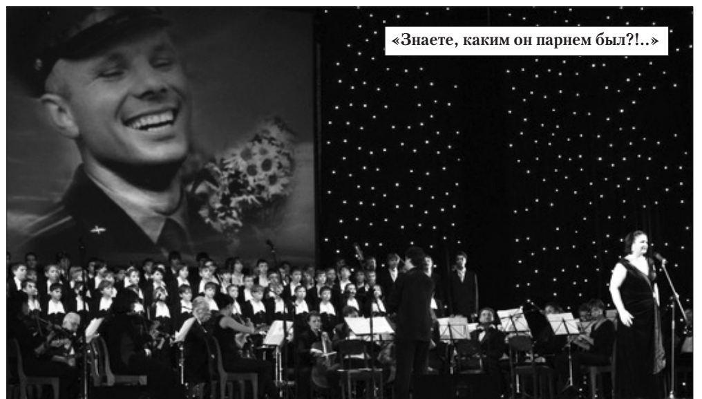
«Знаете, каким он парнем был?!..»