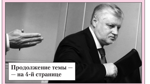
Продолжение темы — — на 4-й странице

Участвовать в разборках внутри власти по этому вопросу, спровоцированных «Единой Россией», мы не станем. Но, учитывая все сказанное выше, фракция КПРФ в Законодательном Собрании Санкт-Петербурга будет голосовать за досрочное прекращение полномочий члена Совета Федерации Федерального Собрания Российской Федерации — представителя Законодательного Собрания Санкт-Петербурга четвертого созыва Сергея Михайловича Миронова.